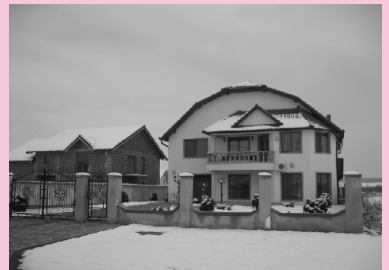
Case noi Căstău