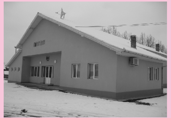
Căminul Cultural Căstău